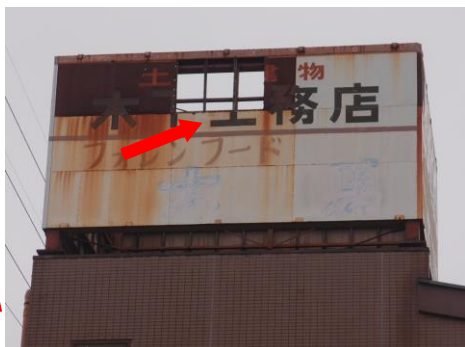
広告板が剥がれています☹️