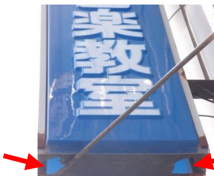
腐食して穴が開いています☹️

日ごろのチェックも必要ですが、 目安として設置後10年以上経過した看板は 、専門家の点検を受けるようにしましょう。 ※年数を問わず専門家の点検を義務付けている自治体もあります。